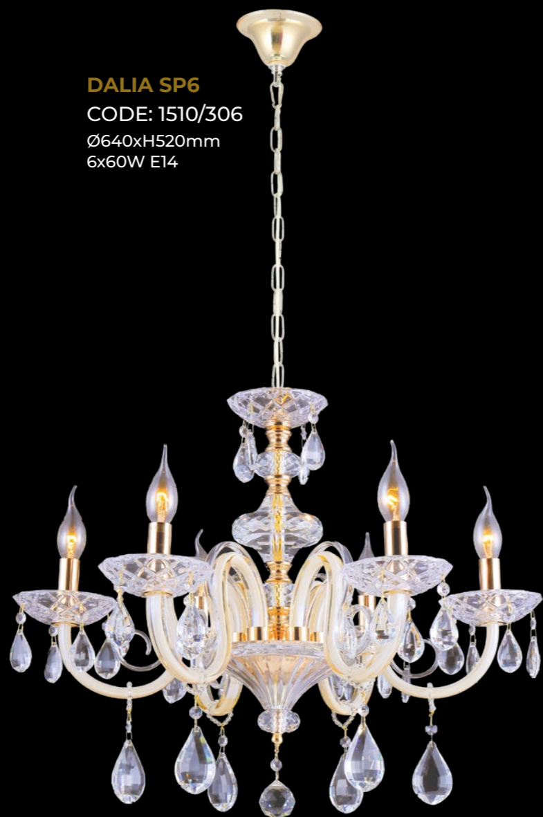
DALIA SP6 CODE: 1510/306 Ø640xH520mm 6x60W E14