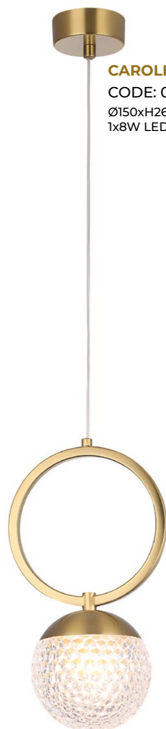
CAROLINA SP1 V1 BRASS