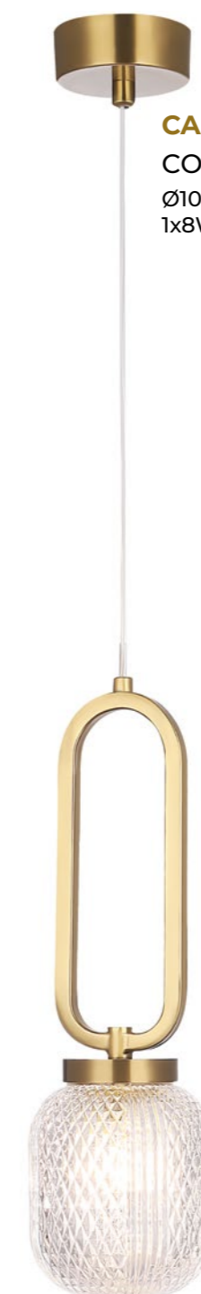
CAROLINA SP1 V2 BRASS