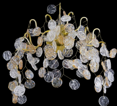
TENERIFE AP2 CODE: 3180/402 L373xW182xH287mm 2x40W G9