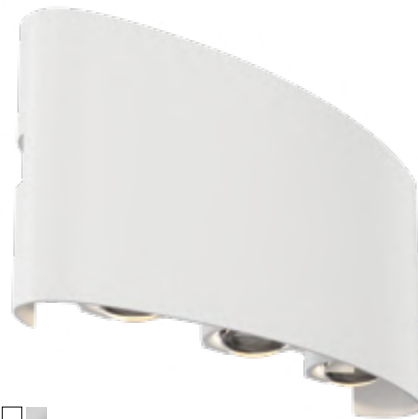
2 ■ □ ▒