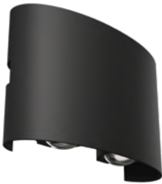
1 ■ □ ▒