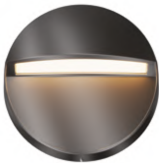
1 ■ □