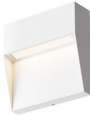
2 ■ □