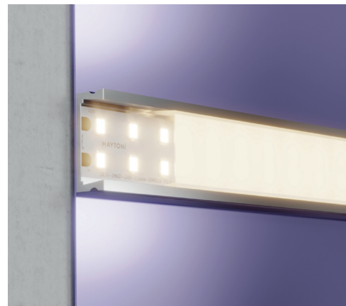
20028 Пример монтажа ленты в накладном профиле.