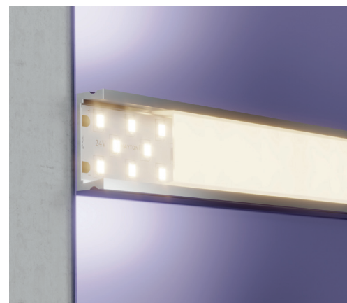
20031 Пример монтажа ленты в накладном профиле.