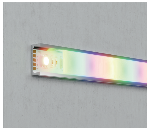
10179 Пример монтажа ленты в накладном профиле.