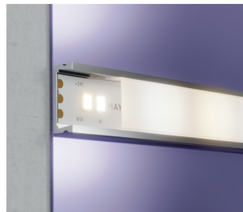
20041 Пример монтажа ленты в накладном профиле.