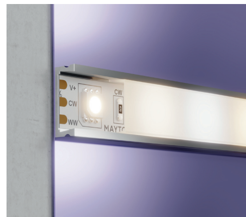
20042 Пример монтажа ленты в накладном профиле.