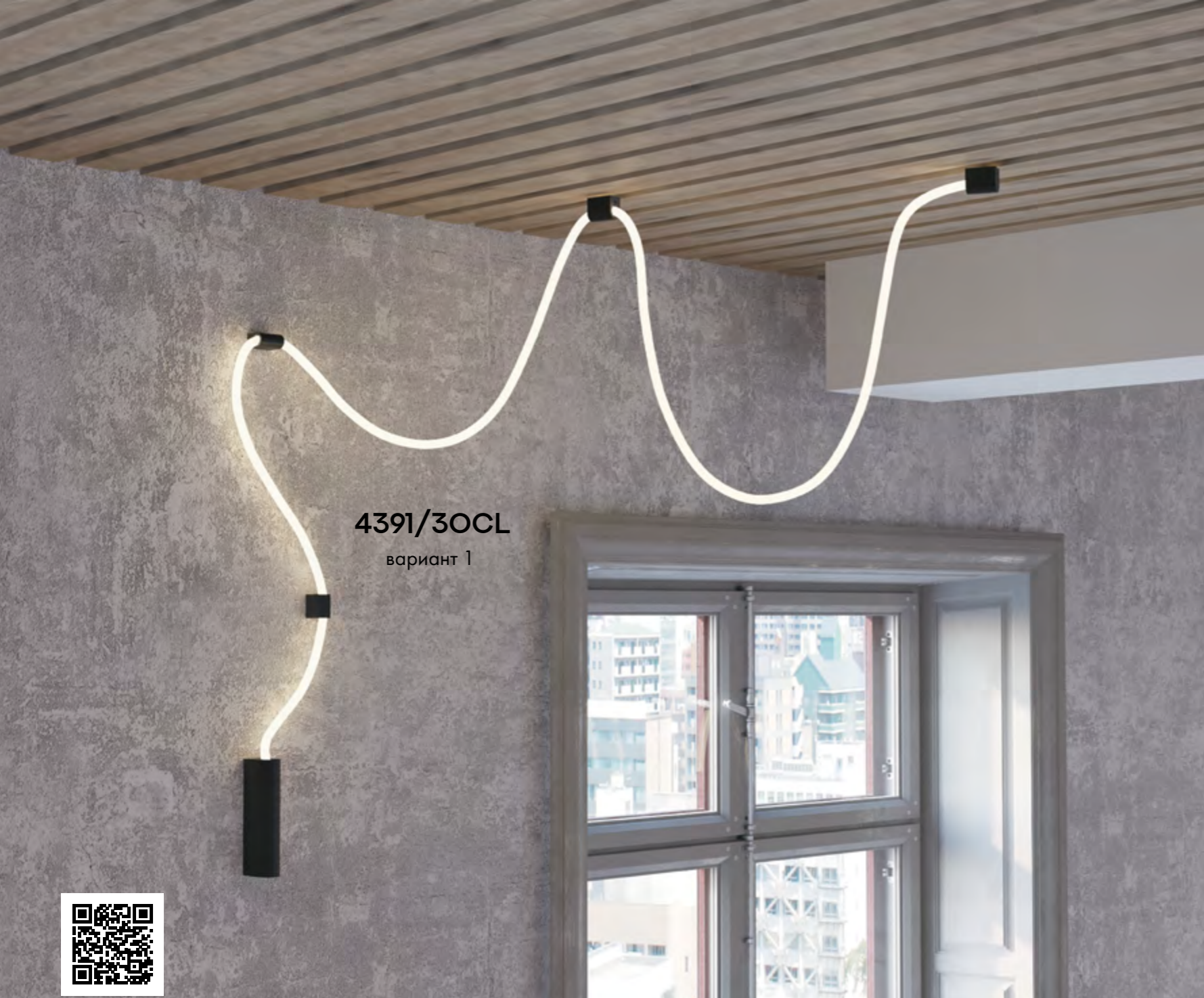
4391/30CL вариант 1