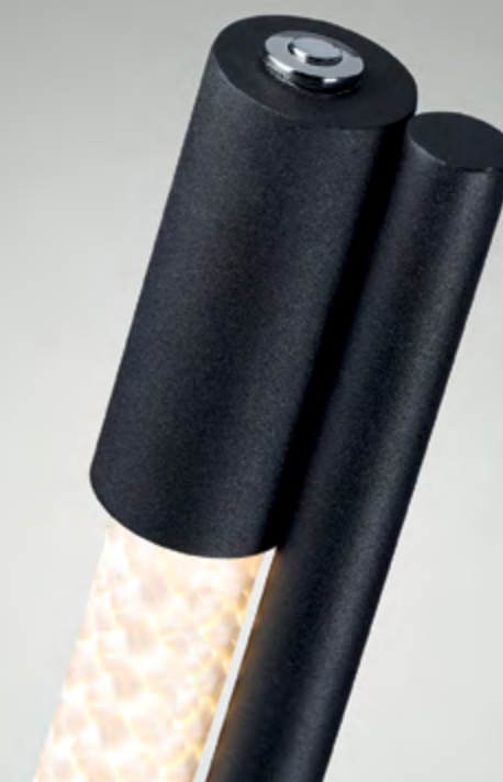
4391/30CL вариант 2