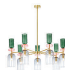
SL2000.202.07 золото | дымчатый | зеленый

цоколь E14 5 × 40 W ↓ min 400 / max 1600 | ↔ 700 металл | стекло