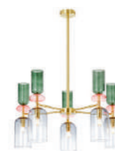
SL2000.202.05 золото | дымчатый | зеленый