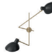
SL1803.201.02 черный | золото | черный

цоколь E27 1 × 60 W ↑ 250 | ↔ 180 | ↗ 360 металл | алюминий