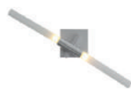
SL947.101.02 серебристый | белый