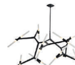
SL947.402.20 черный | белый

цоколь G9 14 × LED / 5 W в комплекте 4000 K ↗ 400 | ↓ min 730 / max 1800 | ↔ 1600 металл | стекло