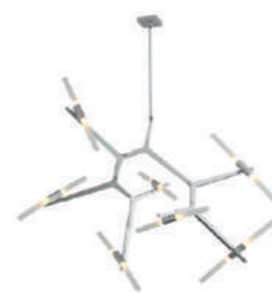
SL947.102.14 серебристый | белый

цоколь G9 10 × LED / 5 W в комплекте 4000 K ↗ 400 | ↓ min 950 / max 1500 | ↔ 700 металл | стекло