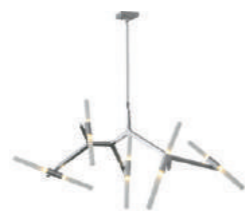
SL947.102.10 серебристый | белый

цоколь G9 2 × LED / 5 W в комплекте 4000 K ↑100 | ↔ 600 | ↗ 600 металл | стекло