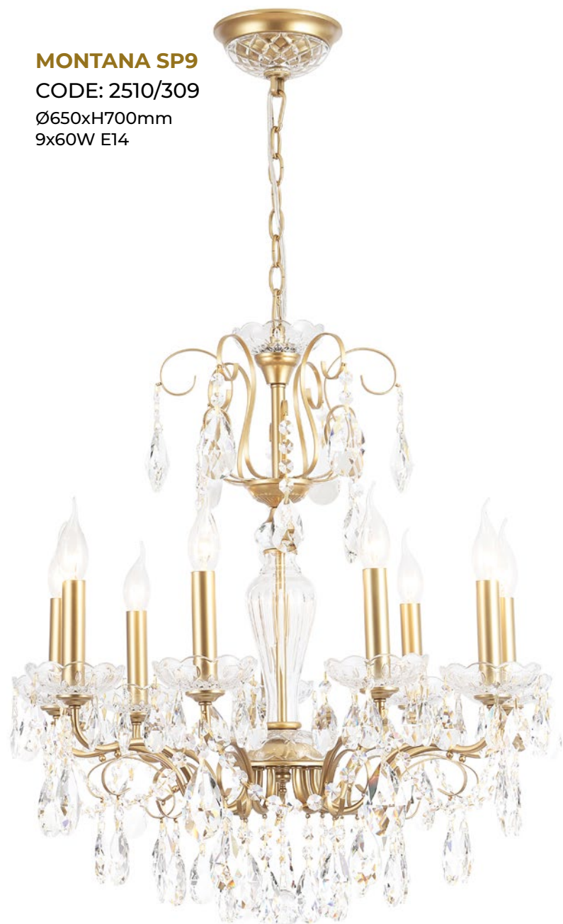
MONTANA SP9 CODE: 2510/309 Ø650xH700mm 9x60W E14