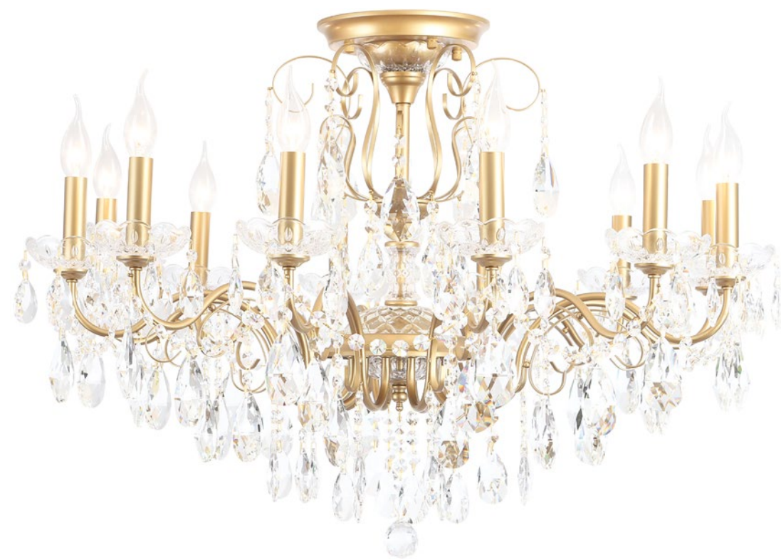
MONTANA PL12 CODE: 2510/112 Ø880xH620mm 12x40W E14