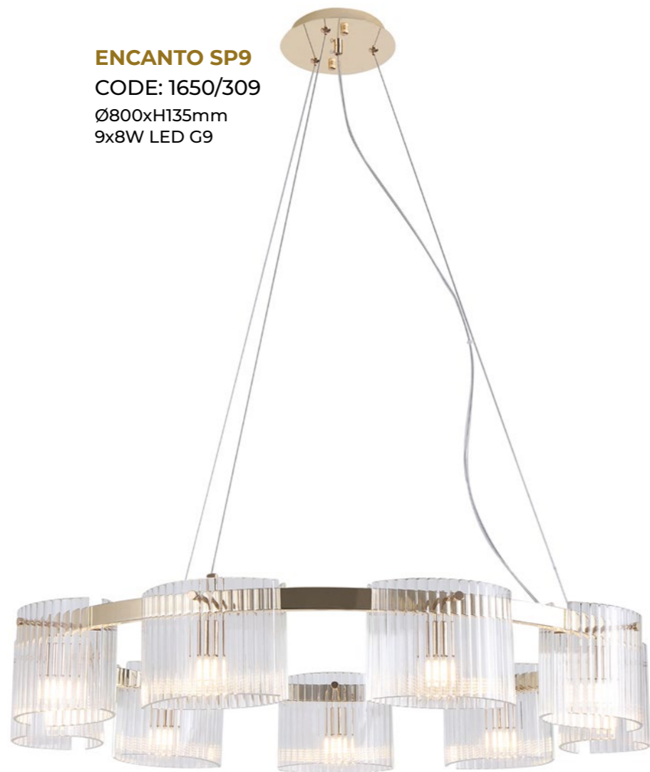
ENCANTO SP9 CODE: 1650/309 Ø800xH135mm 9x8W LED G9