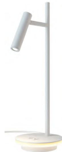
2 ■ □