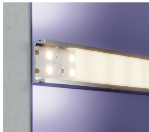
20034 Пример монтажа ленты в накладном профиле.