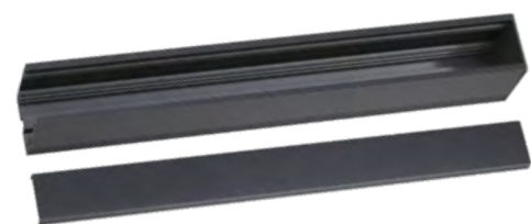
135031 IP 20 черный Коробка для драйверов В комплекте соединители Алюминий (В*Ш*Д) 62,8*50, 6*360 мм