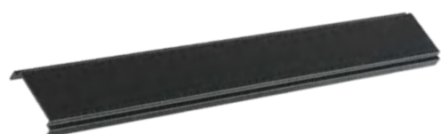
135111 IP 20 черный Крышка для шинпровода Металл (В*Ш*Д) 11*41,1*370 мм