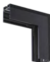
135030 Соединитель для шинпровода «L» (Д*Ш*В*Г) 200*200*50,6*62,8 мм