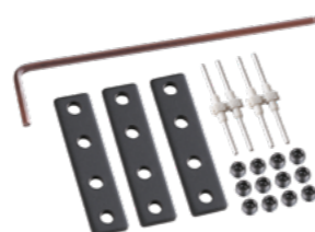
135027 Крепление для встраиваемого монтажа