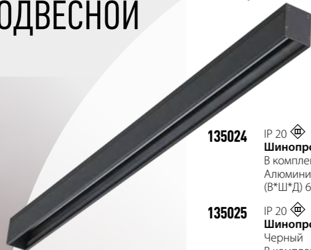
135024 IP 20 Шинопровод 1000 мм В комплекте соединители Алюминий (В*Ш*Д) 62,8*50,6*1000 мм