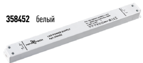
IP 20 Драйвер Пластиковый корпус Выходная мощность: 100 Вт Выходное напряжение: 48 В Входное напряжение: 200–240 В (Д*Ш*В) 320,6*30*18,2 мм