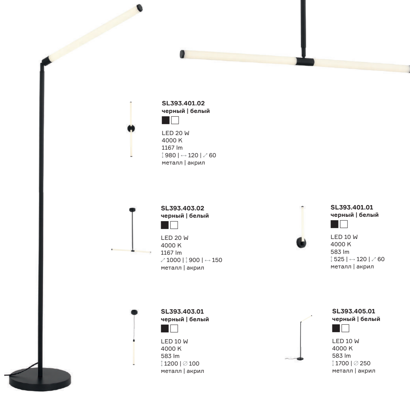
SL393.401.02 черный | белый

LED 20 W 4000 K 1167 lm ↓ 980 | ↔ 120 | ↗ 60 металл | акрил